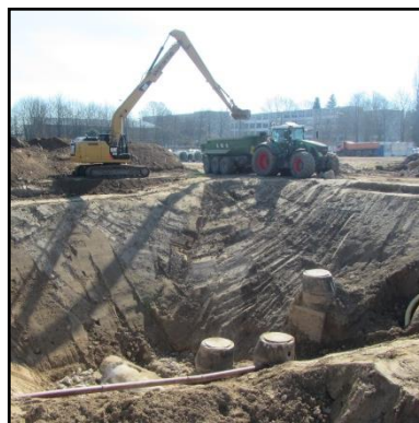
Schwerin, Bebauungsgebiet Lankow (Bausumme: ca. 2.700.000 €)