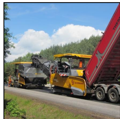
A 24 RF Berlin Kilometer 158 – 168 (Bausumme: ca. 3.400.000 €)